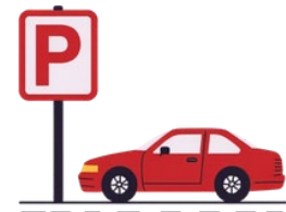
Mejorar el estacionamiento