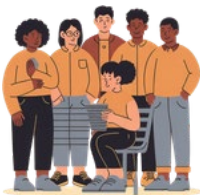
Crear grupos de padres