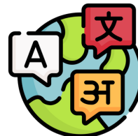
Contratar más personal multilingüe