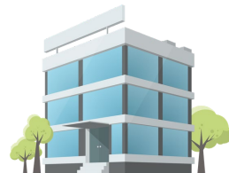
Hacer el edificio más acogedor